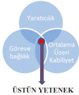
Şekil 1: Renzulli'nin Üç Halka Kuramı'nın Şematik Gösterimi

Renzulli, üstün yetenekli kişiler için bu modelde yer alan özelliklerin yani; genel yetenek, genel yaratıcılık ve görev sorumluluğu kavramlarının birleşimini geliştirebilen ve insan performansının kıymetli alanlarından bir ya da birkaçına uygulayabilen bireyler olarak bahsetmiştir.